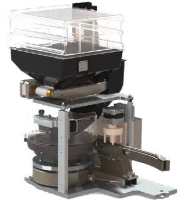
Diagnostikgeräte der Pharmaindustrie

Überzeugen Sie sich von unserer Kompetenz und besuchen Sie uns in Liestal für ein unverbindliches Gespräch und Besichtigung unserer Firma.